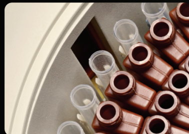
Lector de código de barras integrado