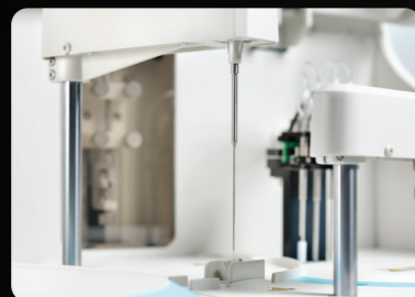
Barra de mezcla independiente