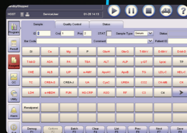
Software inteligente con interfaz fácil de usar