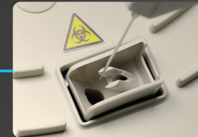
Limpieza de sonda de caída de agua