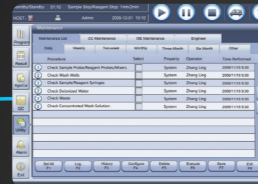
Guía de mantenimiento paso a paso